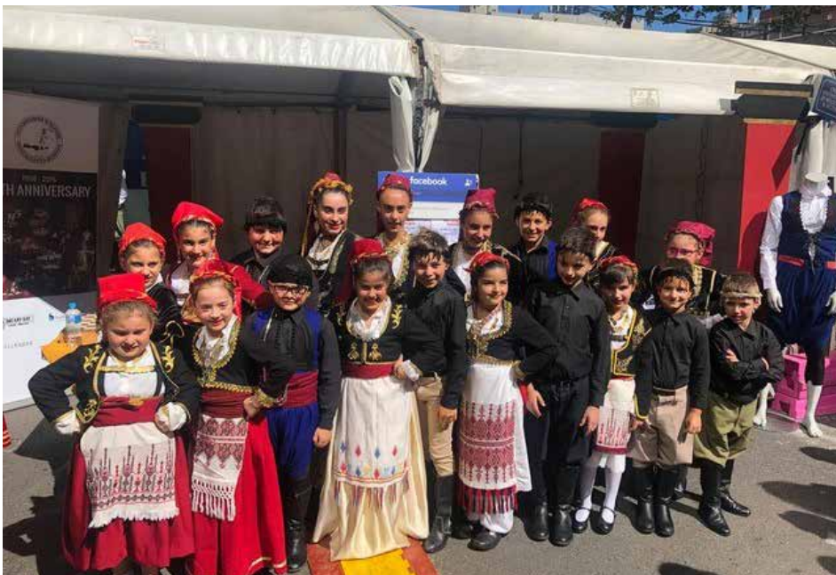
Junior Dance Group