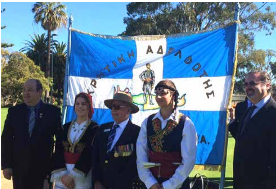
80th Anniversary Battle of Crete 2021