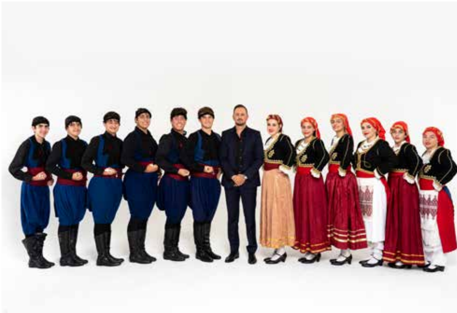
Senior Dance Group