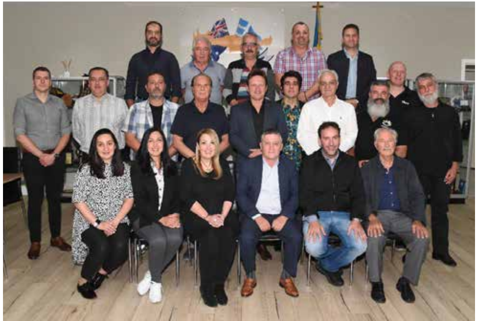
Senior Executive Committee

Office: Cretan Village, 90 Cathies Lane Wantirna South VIC 3152 Telephone: (03) 9800 0148 Mobile: 0408 246 722 Email: info@pancretan.com.au