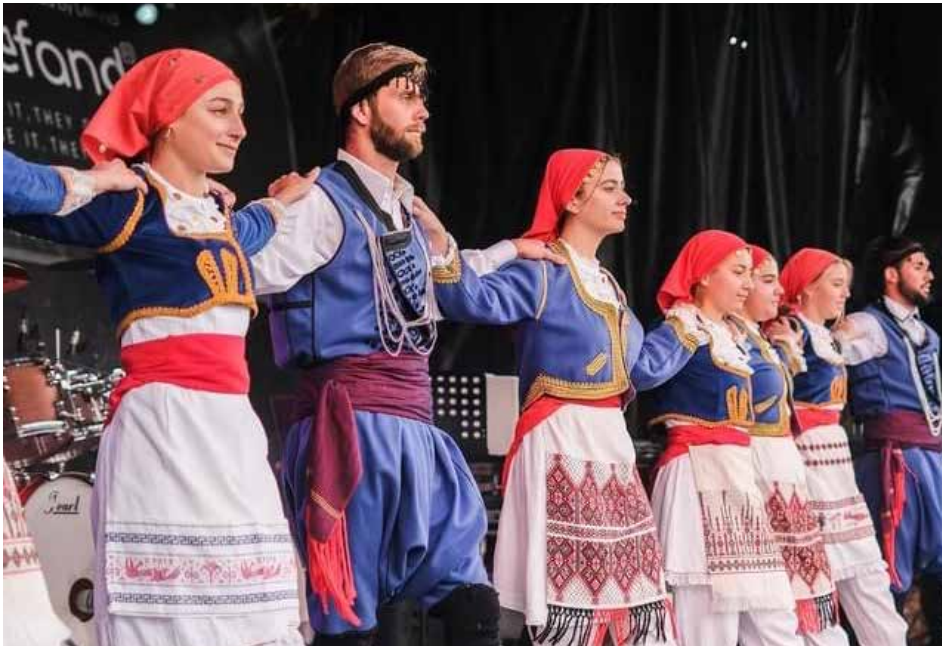
Senior Dance Group