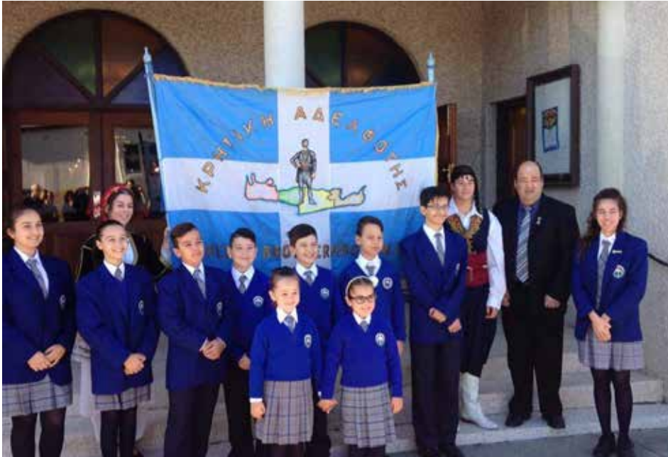
80th Anniversary Battle of Crete 2021