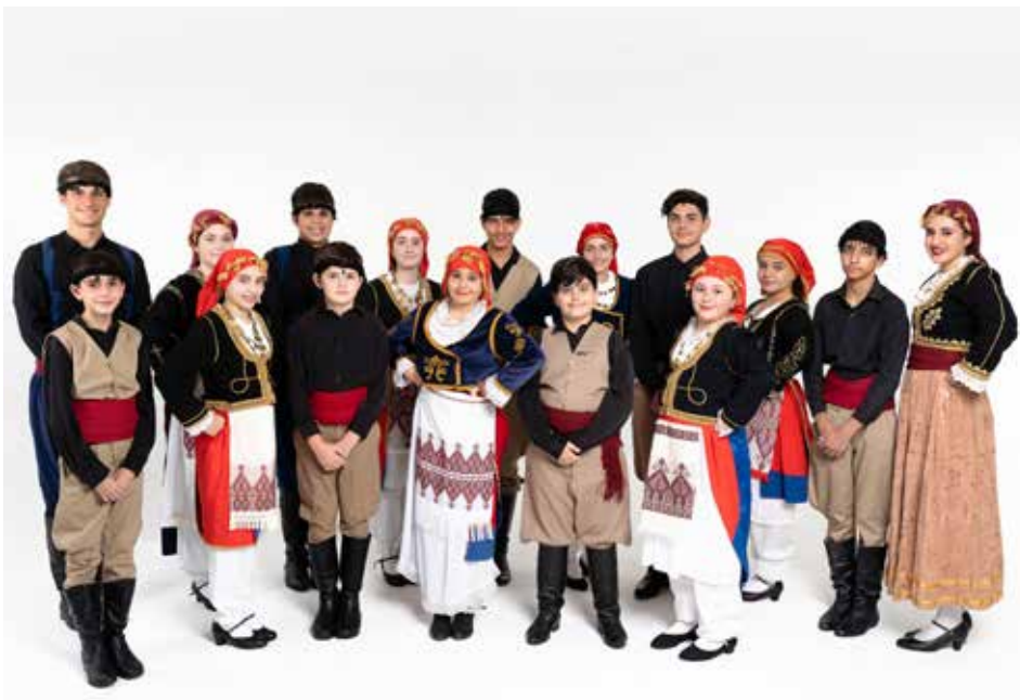
Intermediate Dance Group