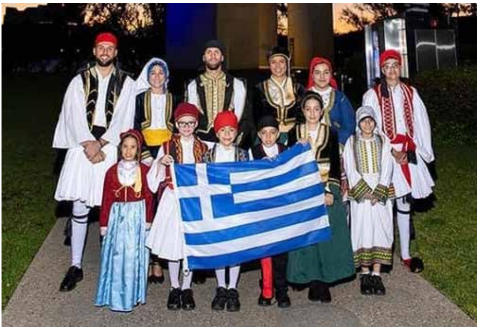
Junior Dance Group