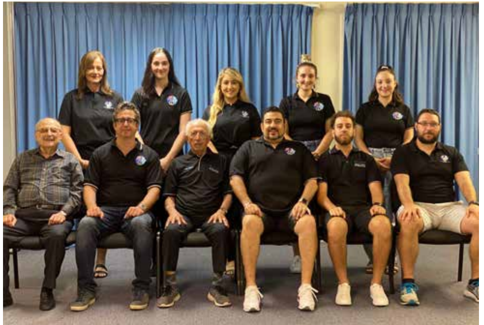
Senior Executive Committee