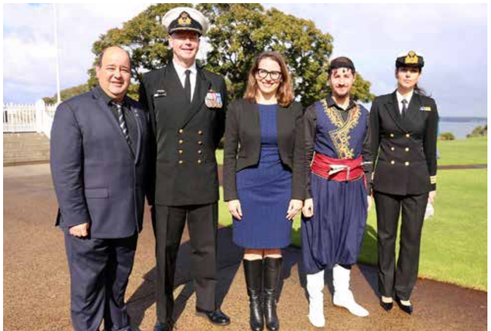
80th Anniversary Battle of Crete 2021