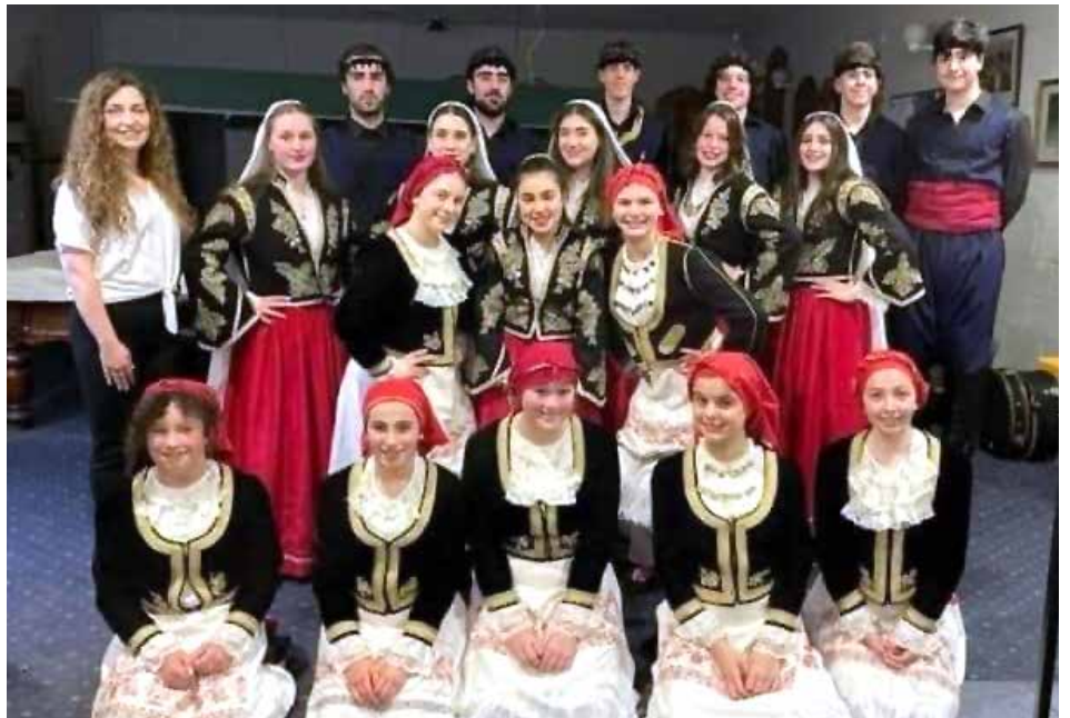
Senior Dance Group