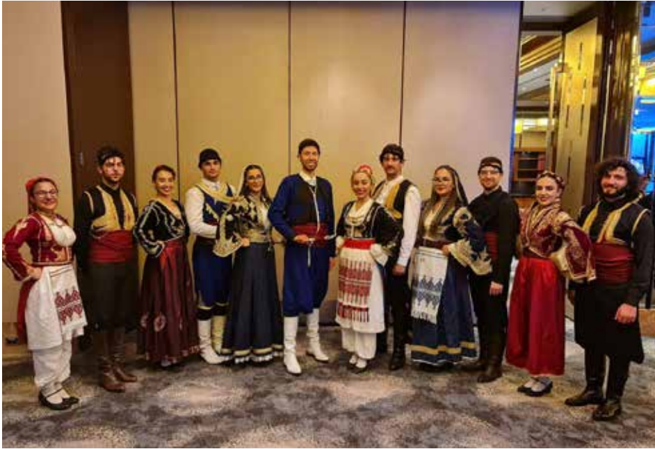
Senior Dance Group