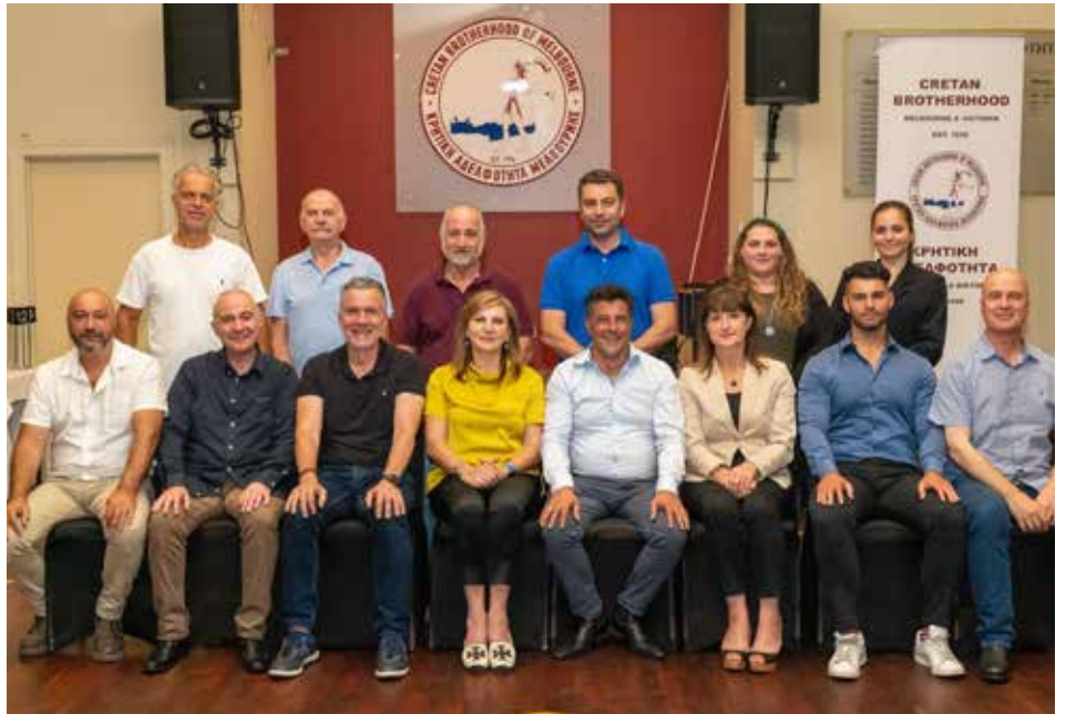
Senior Executive Committee

Email: secretary@cretanbrotherhood.com.au