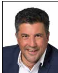
Milton Stamatakos Public Relations