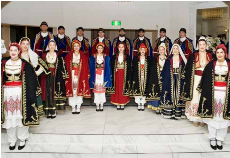
Senior Dance Group