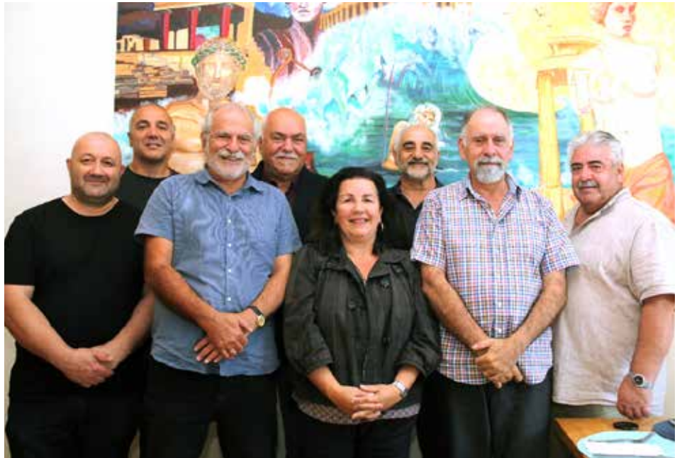
Senior Executive Committee