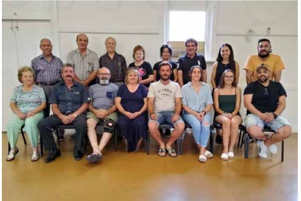
Senior Executive Committee

220 Port Road Alberton, S.A. 5014 Mobile: 0416 947 817 Email: p.fridakis777@gmail.com