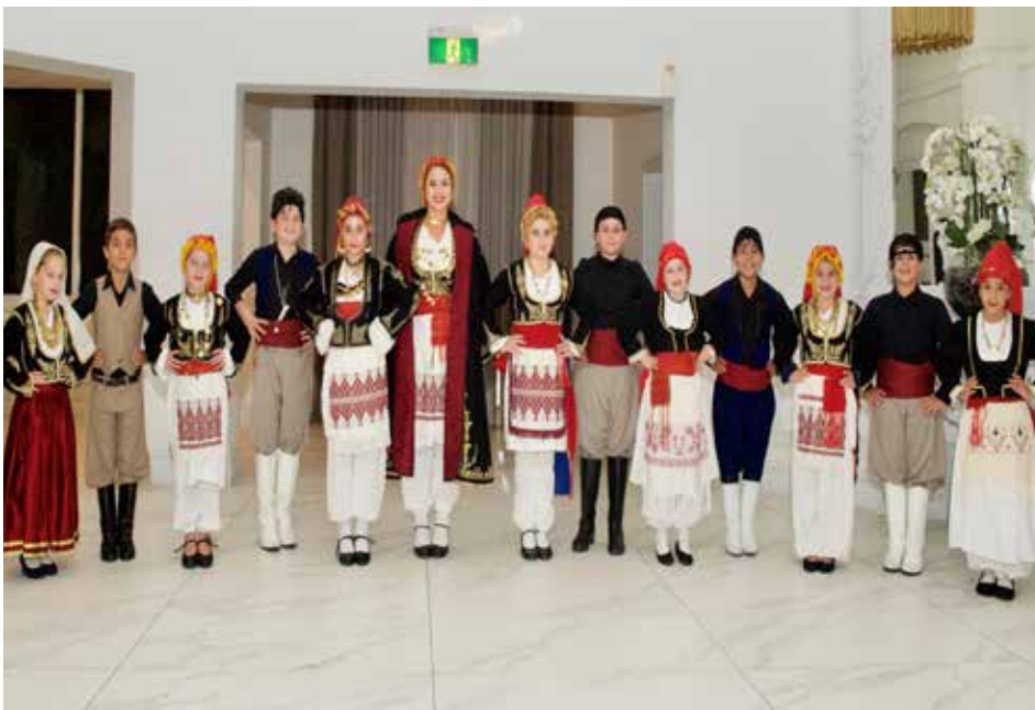
Junior Dance Group