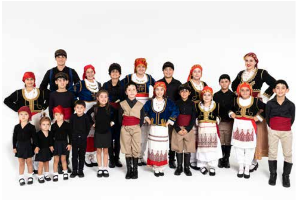
Junior Dance Group