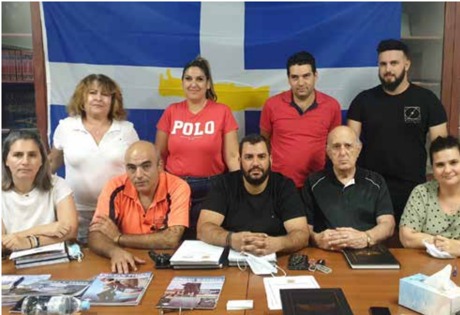
Senior Executive Committee