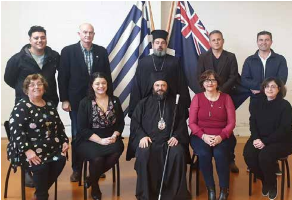
Senior Executive Committee