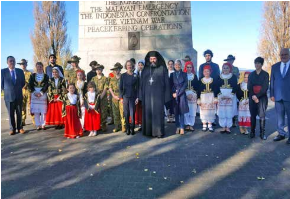
80th Anniversary Battle of Crete 2021