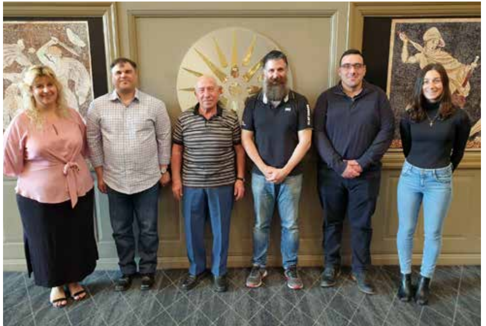
Senior Executive Committee

G. P. O. Box 2128, Canberra, A.C.T. 2601 Mobile: 0450 960 220 Email: georgeak@kdngroup.com.au