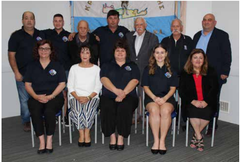
Senior Executive Committee